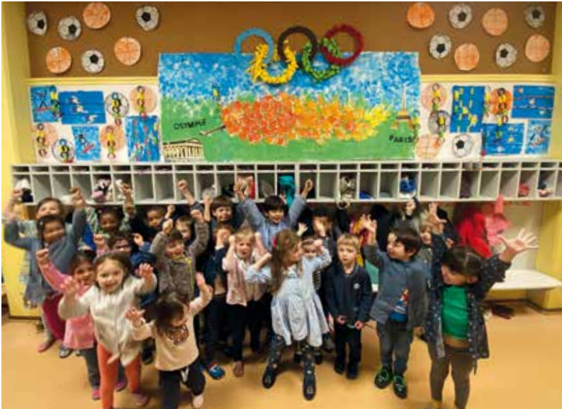
• Fresque des maternelles – Le Gymnase

Tout au long de l'année scolaire, la solidarité et le partage, valeurs essentielles au Gymnase, ont été mises en lumière à travers la préparation des Jeux Olympiques de Paris 2024. Ainsi, chaque élève de la maternelle à la terminale a pu apporter sa pierre à l'édifice et participer à son niveau à de nombreuses activités, qu'elles soient sportives, artistiques, scientifiques ou historiques. Focus sur le site de Lucie Berger.