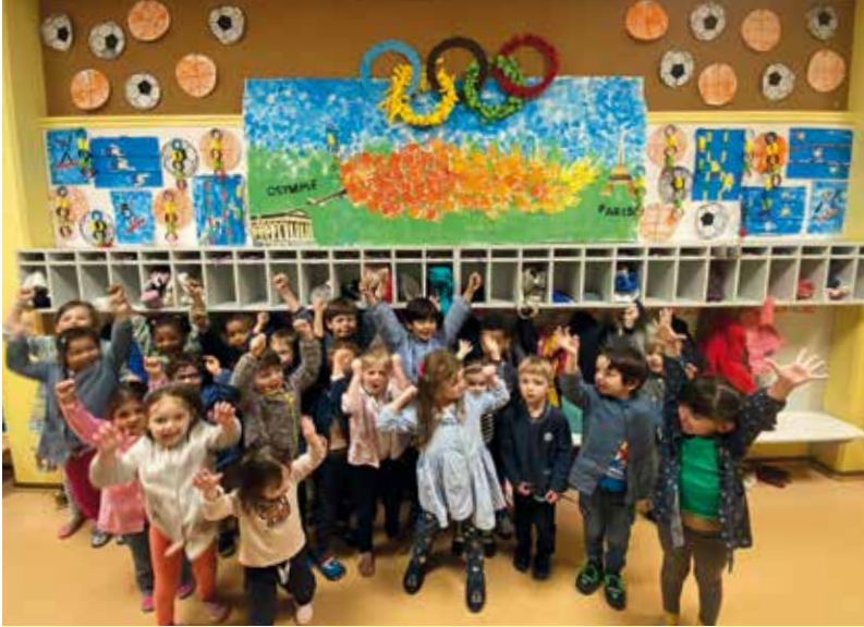
• Fresque des maternelles – Le Gymnase

Tout au long de l'année scolaire, la solidarité et le partage, valeurs essentielles au Gymnase, ont été mises en lumière à travers la préparation des Jeux Olympiques de Paris 2024. Ainsi, chaque élève de la maternelle à la terminale a pu apporter sa pierre à l'édifice et participer à son niveau à de nombreuses activités, qu'elles soient sportives, artistiques, scientifiques ou historiques. Focus sur le site de Lucie Berger.