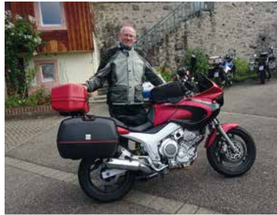
• Motard équipé pour la route après la prière du matin

Cette année 2023-2024 a été très riche : prière, travail, accueil, partages et rencontres. Les groupes occupent toujours la majorité des week-ends tandis que les hôtes individuels ou les familles viennent tout au long de l'année et plus particulièrement pendant les congés scolaires. La majorité des groupes est très fidèle et revient d'une année à l'autre. Même les motards font retraite en silence et sont présents à la prière. Mais ils s'échappent chaque jour pour une balade.