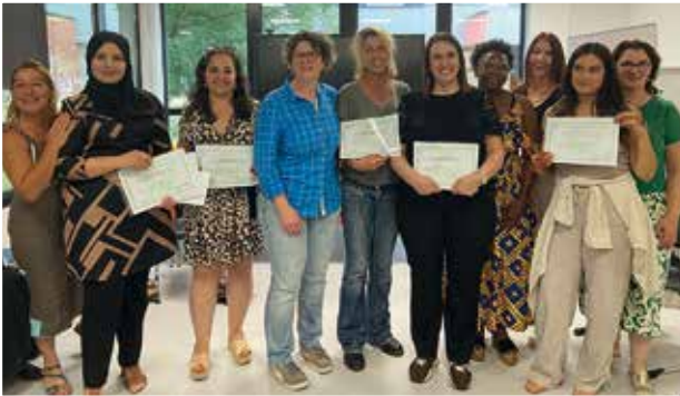
• Cérémonie de remise des diplômes AES 2022

Chargée de communication et documentaliste