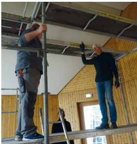
• Installation de la climatisation à la chapelle